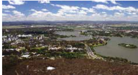
Yderst til højre: Romaldo Giurgolas delvis nedgravede parlamentsbygning fra 1987.

på betydningen af Marion Mahony Griffins renderinger. Der udgår en stærk udstråling fra det monumentale sceneri, der vækker minder om de fabelagtige tegningers funklende skær, og der går muligvis en rød tråd fra Griffins prospekter for Canberra over den amerikanske mestertegner Hugh Ferriss til vore dages filmæstetik.