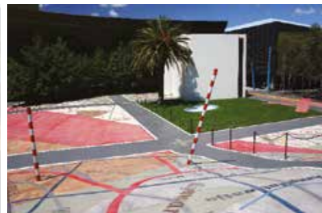
The National Museum of Australia er tegnet af de australske arkitekter Aston Raggat McDougall og Robert Peck von Hartel Tretowan, 2001. Museet ligger yderst på Acton halvøen i den kunstige sø Burley Griffin.