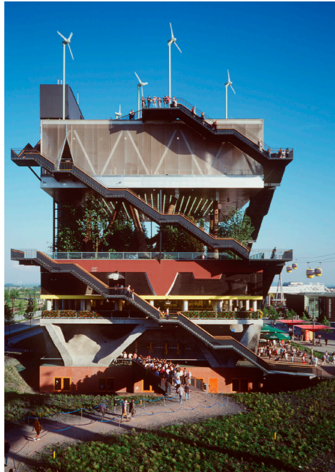
MVRDV's stablede landskaber fra Hannover Expo 2000.