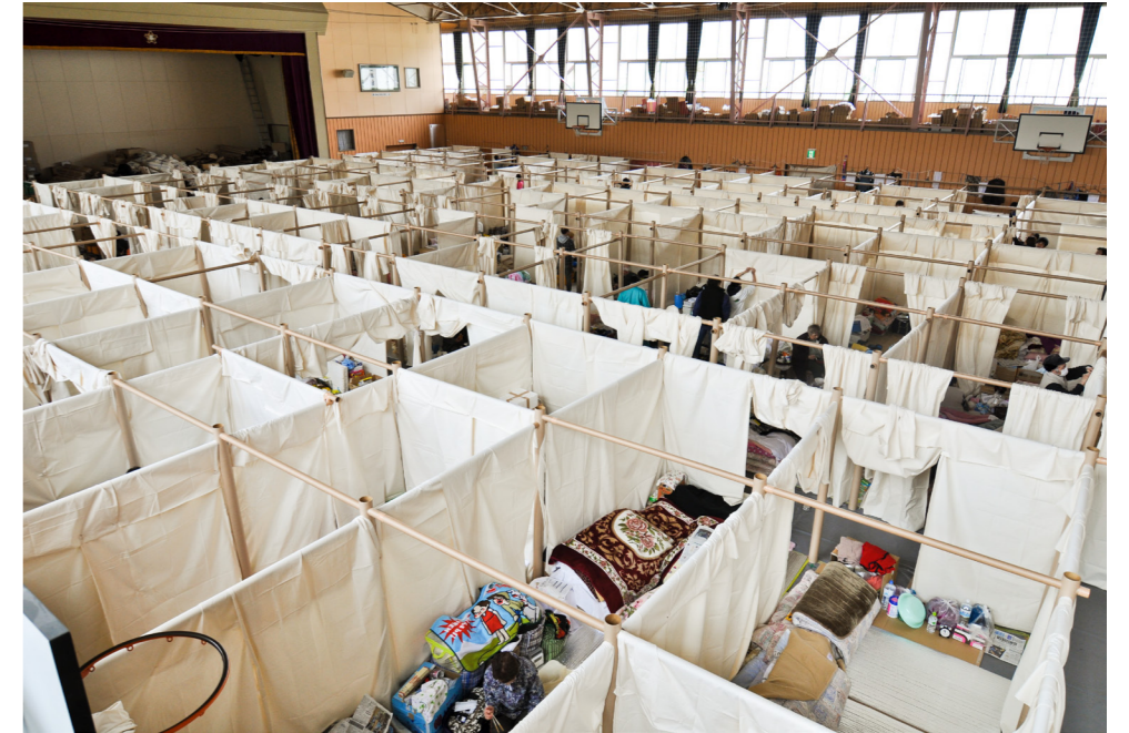
Den japanske arkitekt Shigeru Ban har længe arbejdet med arkitektonisk hjælpearbejde i form af midlertidige installationer. Her ses hans indsats for ofre efter den seneste naturkatastrofe i Japan

I den anden ende af spektret i snitfladen mellem arkitektur, kunst og landart finder man fx kunstnerparret Christo og Jeanne-Claude, hvis arbejde ofte forsøgte at fremkalde en 'anden' skønhed i bygninger og landskaber, eller Olafur Eliasson med værkerne „Weather Project” på Tate Modern eller „Your Split Second House” fra Venedig Biennalen 2010. Folk