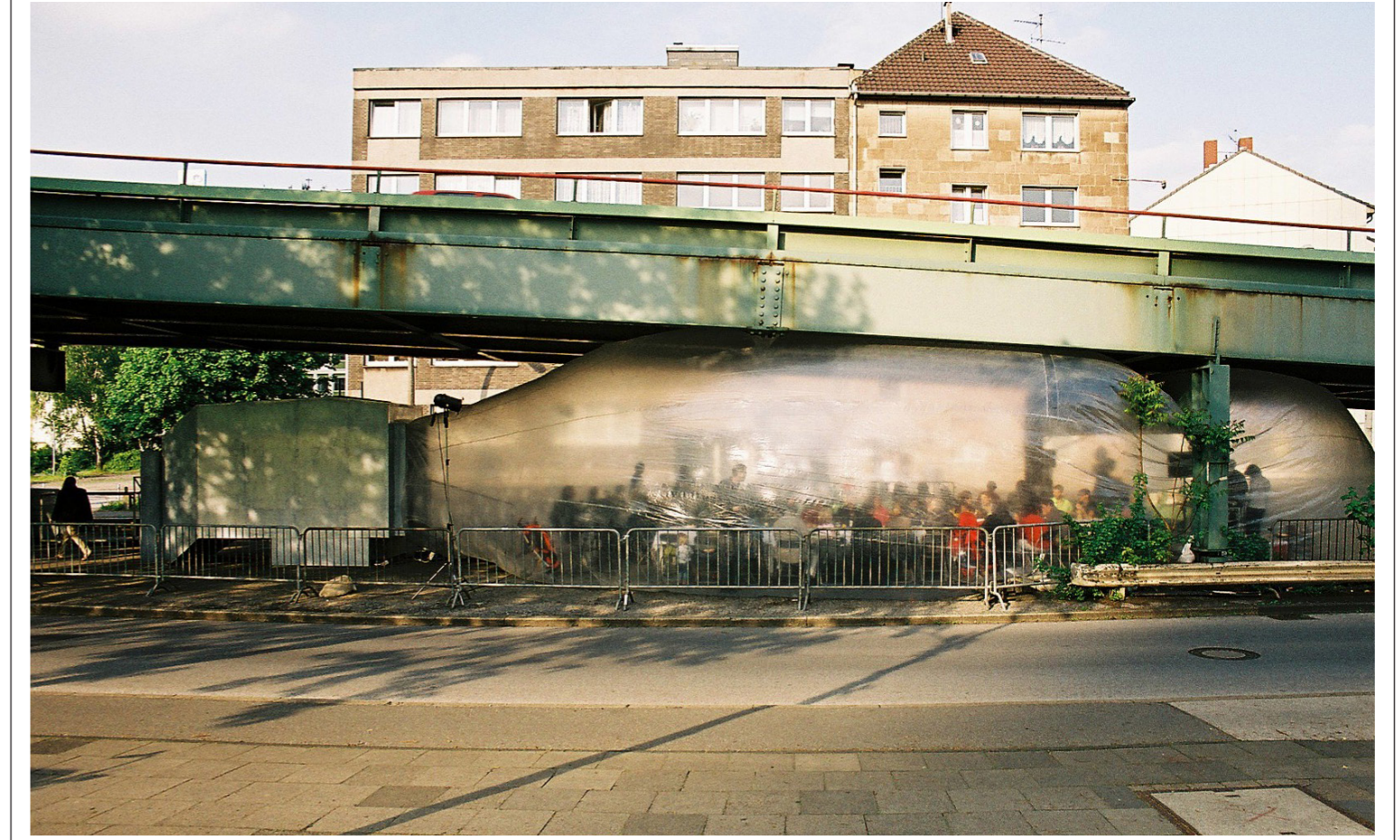
De berlinske arkitektgrupper Raumlabs og Plastique Fantastiques installation 'Küchenmonument' har rejst verden rundt og etableret forskellige typer af midlertidige fællesskaber i det offentlige rum (se også s. 58 ff).