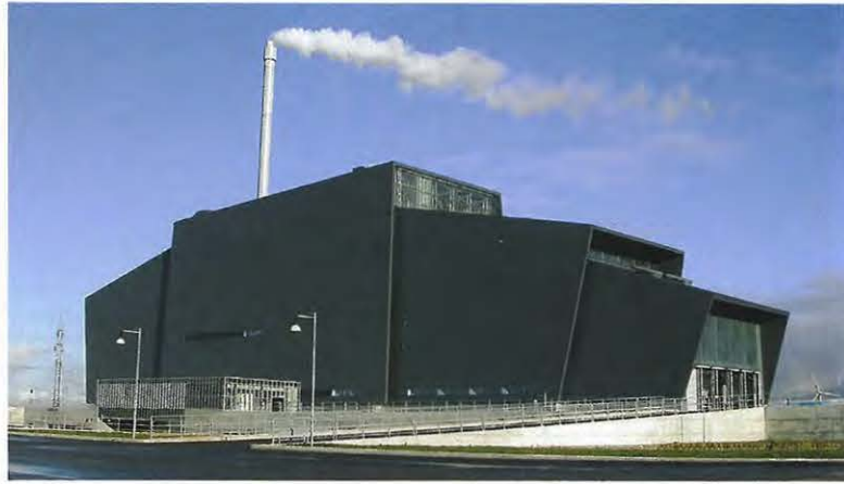
Friis & Moltke's forbrændingsanlæg L90, opført 2002 i Esbjerg. Anlæggets hovedform har visse ligheder med Arkitekgruppen Aarhus' (i dag Arkitema) Silkeborg Kraftvarmeværk fra 1996 (se ARKITEKTUR DK 7/1996).

■ Friis & Moltke's refuse disposal plant L90, built in 2002 in Esbjerg.