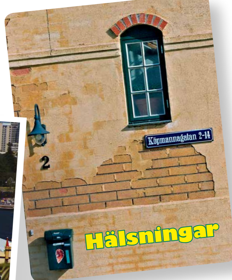
Jakriborg i Lund.