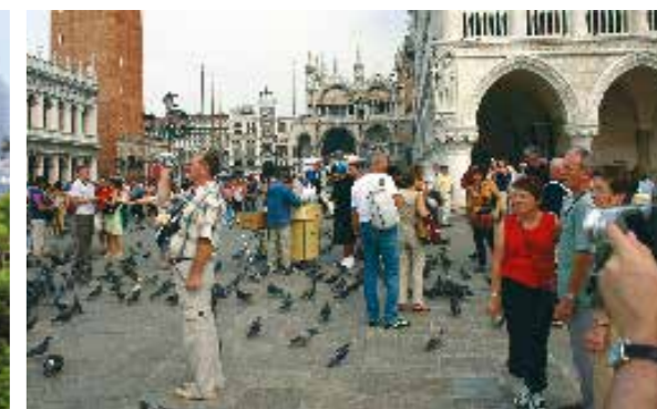
De relativt få mennesker, som reelt bor i Venedig, er blevet til en slags souvenir-stand, der i udpræget grad ernærer sig af hverdagslivets billedværdi.

tråd fra de tidlige foregangsfigurer af aristokrater og frie kunstnersjæle på dannelsesrejse til den moderne charterturist, backpack'eren og de mange nye 'easy-jet'ere' på weekendtur. Men der er naturligvis forskelle på dengang H.C. Andersen med møje og besvær rejste rundt i Europa og samlede inspiration til sit forfatterskab og situationen i dag, hvor det 'grå guld' har fået rejsefeber og store dele af ungdomsgenerationerne tager på verdensturné eller på interrail ned gennem Europa, inden de påbegynder studier og karriereførløb.