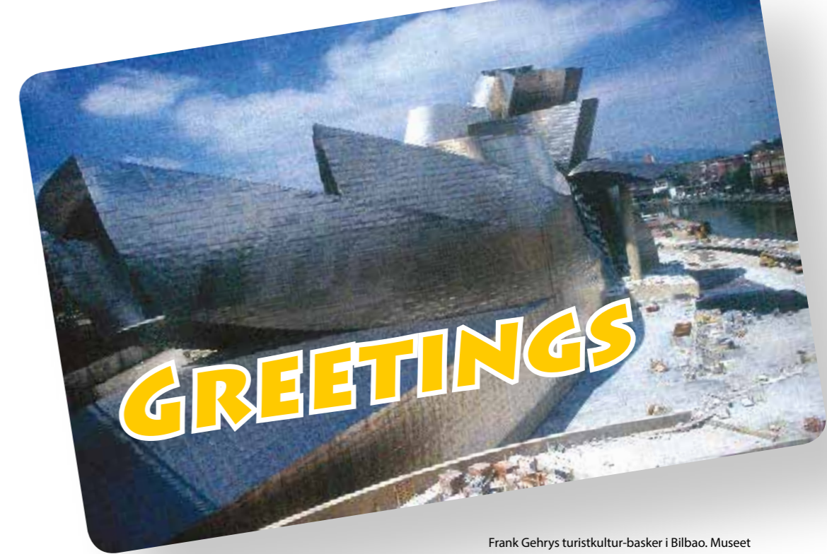
Frank Gehrys turistkultur-baser i Bilbao. Museet står i dag som pragteksempel på, hvordan arkitektur og arkitekturpolitiske ambitioner kan vende en hel regions fremtidsudsigter.