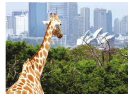
Byen som reservat for turister på fotosafari. Sydney Harbour set fra Taronga Zoo's favorite Kodak-point.