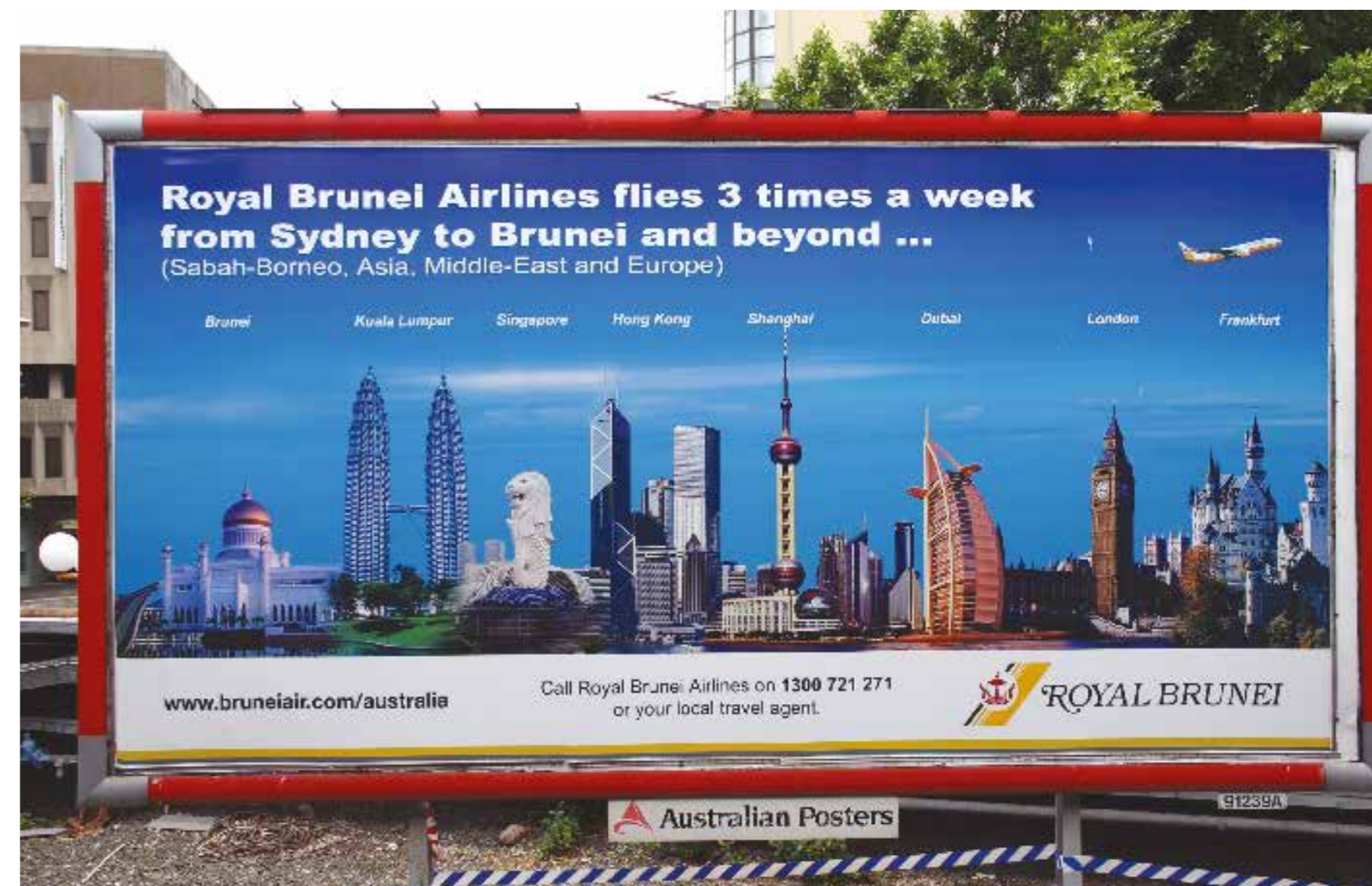
Verden repræsenteret som arkitektonisk opstalt. Bilboardreklame for Royal Brunei Airlines.

Denne ændrede geografi kan opfattes som en trussel imod lokale forhold, men også som en mulighed for at tænke sociale, politiske og kulturelle rum inden for nye globale sammenhænge. Tsunamien, der ramte Thailand i 2004, gav f.eks. meget hurtigt nogle heftige indenrigspolitiske dønninger i Danmark. I Dubai og flere af de små bystater langs den