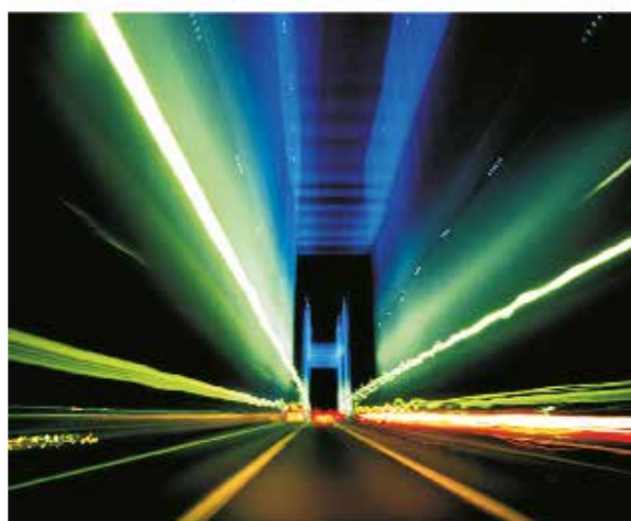
Ulrik Bisgaard & Carsten Friberg (red.) Det æstetiske aktualitet