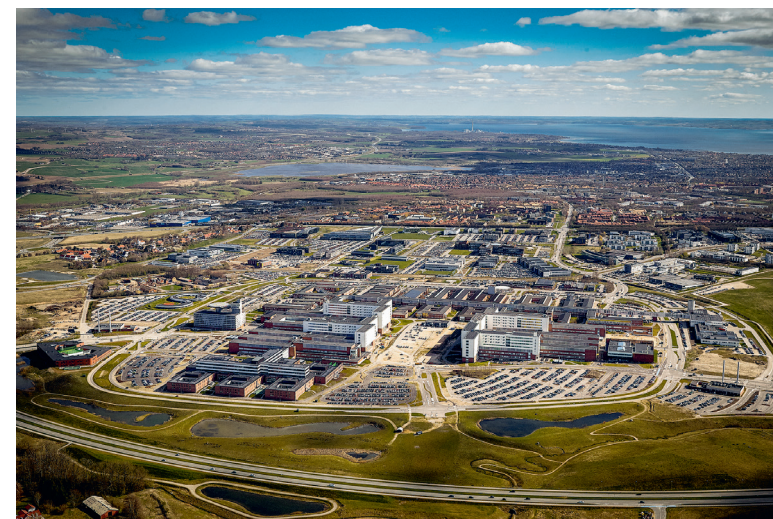
Aarhus Universitetshospital, Skejby

Til gengæld kan jeg ikke i min vildeste fantasi se for mig, hvordan konglomeratet ude i Skejby på nogen måde skal kunne bidrage til andet end nedbrydningsopgaver ude i fremtiden. Vi bruger rigtig mange ressourcer på at kurere folk, der er syge, men alt for få på at finde ud af, hvordan udformningen af vores byer og bygninger kan gavne folkesundheden og forhindre os i at komme på hospitalet.