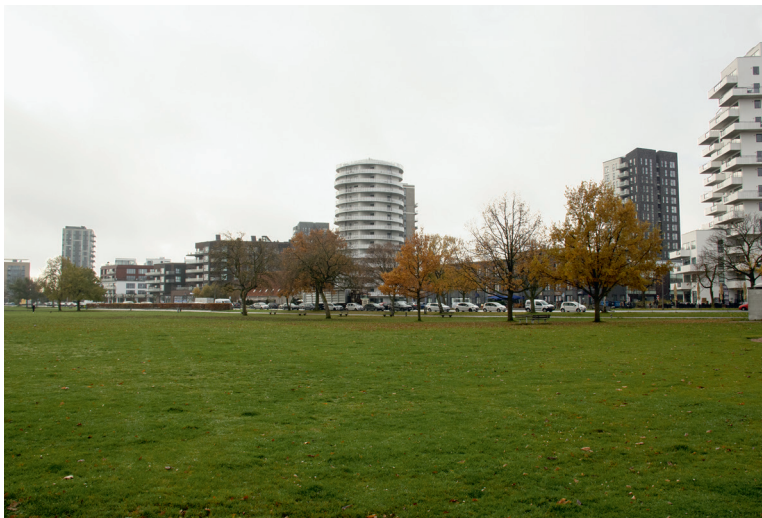
Amager Strandvej, november 2020.