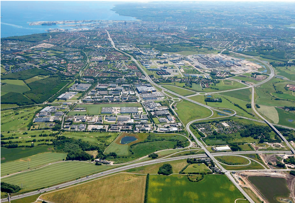
Aarhus set fra Skejby, 2015.